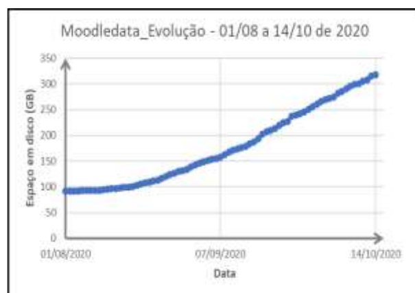
Figura 02

A continuar linearmente esse ritmo de crescimento (figura 03), a projeção é a de que ao final de dezembro tenhamos esgotado o espaço em disco de 600 GB hoje disponibilizado ao Moodle Câmpus. Vale, no entanto, ponderar que é possível que esse ritmo evolua de forma mais acelerada, haja vista o provável aumento de atividades entregues pelos estudantes ao final do 1º semestre letivo.